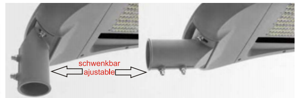
Plug & Play